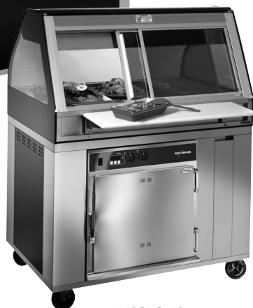
EU2SYS-48 Se muestra la vista posterior con el horno de cocción y mantenimiento 750-TH-III y ruedas opcionales