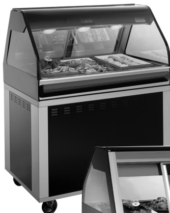
EU2SYS-48 Se muestra la vista frontal con ruedas opcionales