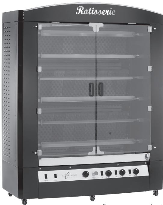
Se muestra con el exterior negro opcional